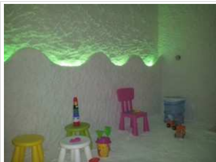
Haloterapia per bambini

Mi piace Condividi Tweet 0 Share G+ Condividi f Condividi